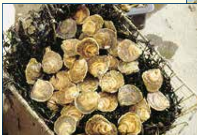
Plates de Belon