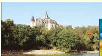
Château du Hénan PATRIMOINE

Ces propositions sont bien sûr modulables.