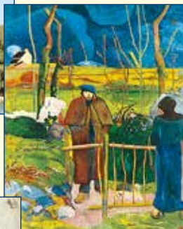
Bonjour M. Gauguin